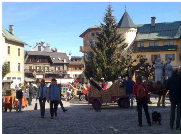
les calèches à Megève