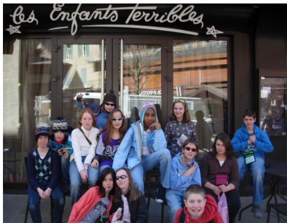
le restaurant « les enfants terribles »

En rentrant au chalet, tout le monde était content de ses achats.