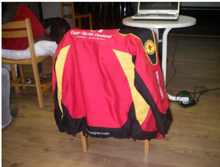
La veste d'une pisteuse française.

Le meilleur truc pour éviter les avalanches, c'est de ne pas skier hors-piste.