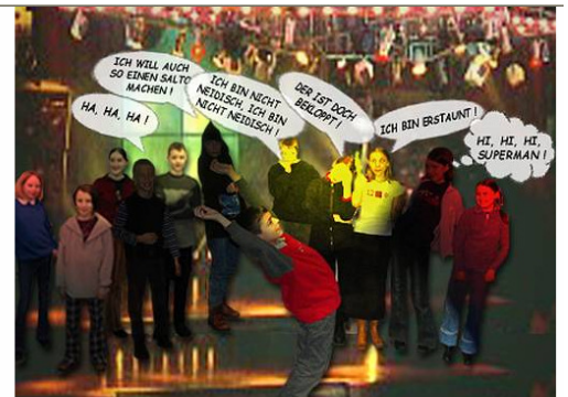
Jetzt macht er einen Spagat. Die Hose reißt ...